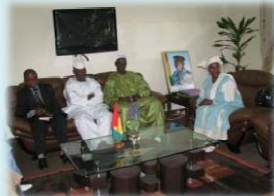
Audience accordée aux membres du CNP par SE Le Colonel Bouréma Condé, Ministre de l’Agriculture et de l’Élevage