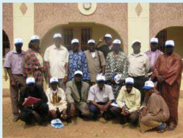
Participants devant le siège du PROGEBE-Mali à Bougouni

Ces formations ont, par la suite, été démultipliées par eux auprès des agro-éleveurs propriétaires de troupeaux de multiplication.