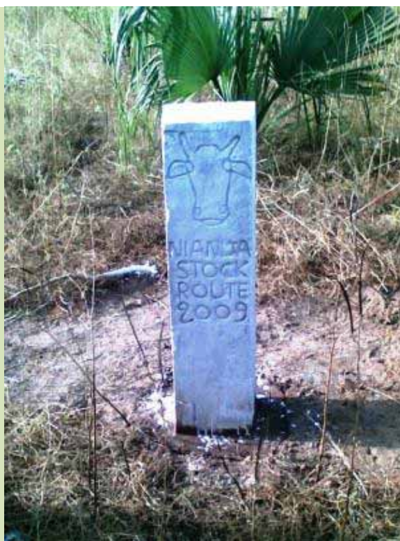
Bornes de délimitation de parcours à bétail à Nianija en Gambie

L'impact et les répercussions ont été ressentis dans tout le district et bien au-delà. Les « Alkalolou » ou « chefs de village » des autres villages ont montré un vif intérêt pour l'exercice de délimitation et demandé à en bénéficier dans leurs zones, reconnaissant ainsi son potentiel de résolution des conflits entre éleveurs et agriculteurs : leur principal problème au cours de la saison culturale. La délimitation des parcours à bétail est devenue très populaire et aujourd'hui fait l'objet d'une très forte demande dans l'ensemble des sites du projet.