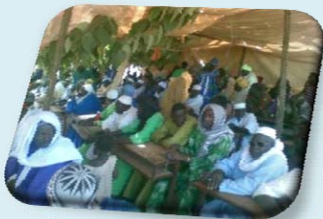
Vue d'un atelier de sensibilisation des communautés en Gambie