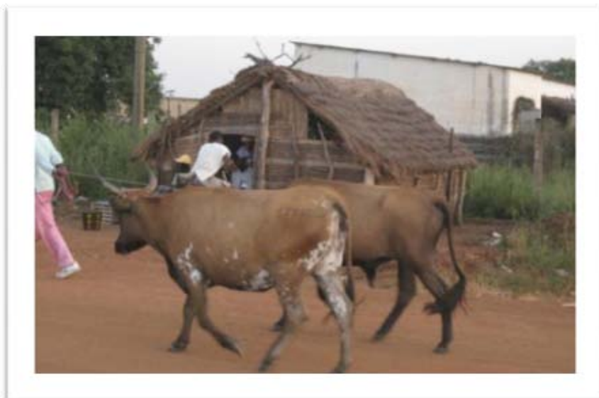
Bovins Ndama, Kédougou, Sénégal