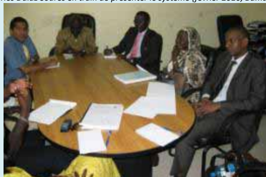
Réunion préliminaire avec le Cabinet Aziz Dieye (novembre 2009, Banjul, Gambie)