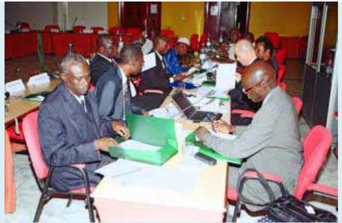
Groupe de travail en pleine délibération

Le rapport de l'atelier sera disponible début mai sur les sites du PROGEBE et de la FAO.