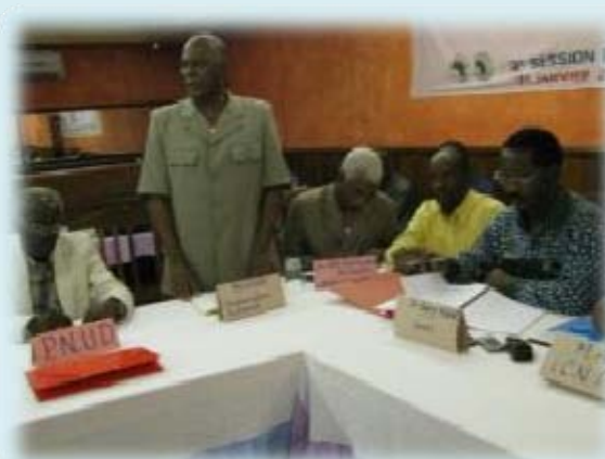
Travaux du CNP du PROGEBE-Guinée, Hôtel Petit Bateau-Conakry

Il a également insisté sur la vaccination contre la peste des petits ruminants (PPR) et la pasteurellose comme une priorité, compte tenu de la forte incidence de ces deux maladies sur la mortalité des petits ruminants et la collaboration avec l’ONG Guinée-Écologie dans le domaine de la gestion des ressources naturelles dans le cadre de la foresterie villageoise.