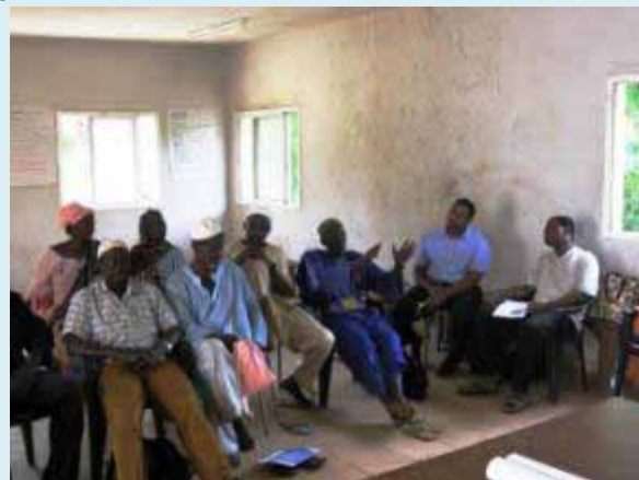
Bandafassi, Sénégal avec l'équipe d'ILRI à droite

La mission a ensuite assisté à une réunion de concertation sur la lutte contre les feux de brousse organisée en étroite collaboration avec l'inspection régionale des eaux et forêts et l'inspection régionale de l'élevage dans le site de Wassadou. Cette rencontre a vu la participation massive des populations de la communauté rurale de Wassadou et des projets et ONG intervenant dans la zone et fut un exemple de parfaite collaboration et de concertation entre les communautés, les services techniques de l'état et les projets et ONG.