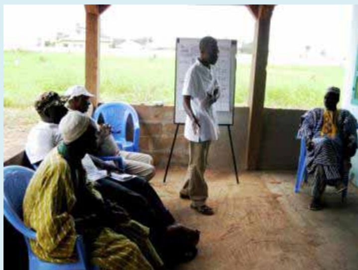
Site de Nianija, Gambie