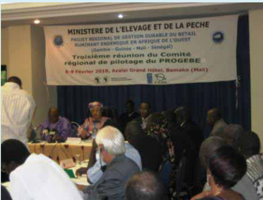
S.E. le Ministre de l'Élevage et de la Pêche du Mali ouvrant la réunion du CRP du PROGEBE

Conformément aux conclusions de la deuxième session du CRP et suite aux assurances données par la délégation guinéenne, la réunion a décidé de tenir la prochaine réunion du Comité régional de pilotage en 2011 en Guinée.